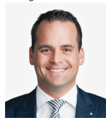
Damian Müller Ständerat

«Die Schweiz braucht ein leistungsfähiges Verkehrsnetz. Der Verkehr muss rollen – auch in Luzern.»