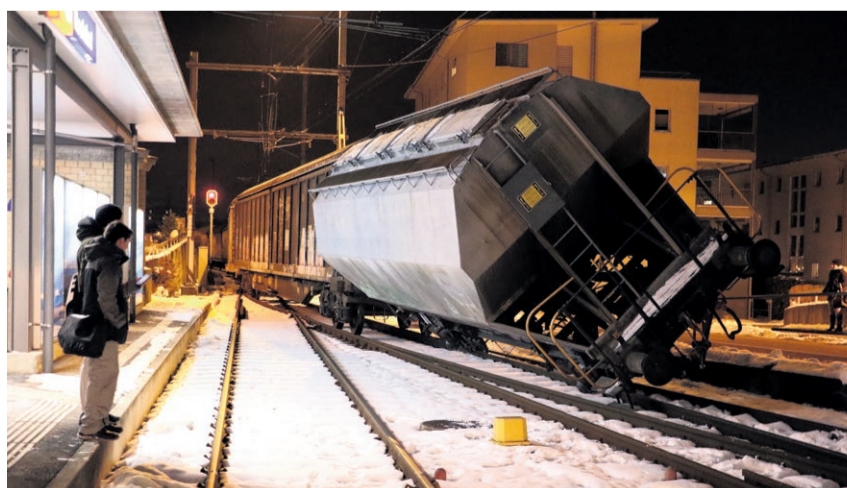
Der entgleiste Güterwagen blockierte die Ausfahrt.

«Wir können noch nicht sagen, warum der Wagen entgleist ist», sagte SBB-Mediensprecher Christian Gin-