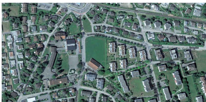
Ein unbebautes Grundstück in Gemeindefestung an prominenter Lage: die Scherrermatte (Bildmitte).

Ziel der Initianten ist, dass das Land, welches heute noch im Gemeindebesitz ist, nicht mehr verkauft werden darf. Boden, der heute der Hochdorfer Bevölkerung gehört, soll auch weiterhin der Hochdorfer Bevölkerung gehören. Die Initiative ist in Form einer Anregung formuliert. «Diese Anregung muss nun zur Abstimmung gebracht